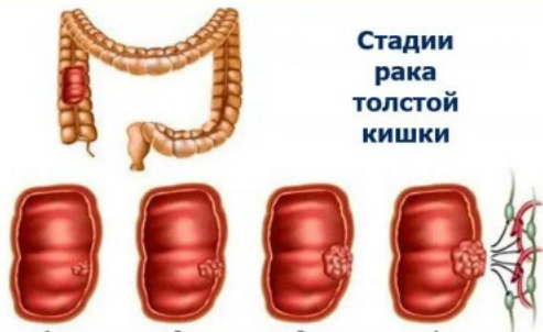
Стадии рака толстой кишки